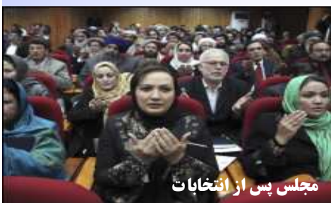
مجلس پس از انتخابات

برای یک دوره ای بیش از سی سال، کشور از داشتن مجلس و تفکیک قوا که از اساسی‌ترین شرایط دموکراسی است، محروم بود. در زمان حاکمیت حزب دموکراتیک خلق هم افغانستان فاقد مجلس بود. در این زمان نهاد حزب به عنوان اصلی‌ترین مرجع صاحب قدرت سیاسی به حساب می‌آمد. در زمان حاکمیت