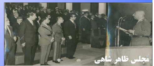
مجلس ظاهر شاهی

محمد نادر شاه (پدر ظاهر شاه، آخرین پادشاه افغانستان) نخستین مجلس شورای ملی را، ۷۹ سال پیش در سال ۱۳۱۰ خورشیدی افتتاح کرد. کار او به نحوی ادامه برنامه اصلاحات امان‌الله خان، شاه پیشین شمرده می‌شود. عبدالحمید مبارز، پژوهشگر و روزنامه‌نگار می‌گوید: «او در جرگه ۳۰۱ نفری سال ۱۳۰۹ دومین قانون اساسی کشور و نخستین قانون انتخابات شورای ملی را تصویب کرد.» عبدالحمید مبارز می‌گوید که بیشتر اعضای این مجلس را سران قبایل تشکیل می‌دادند. این افراد از سوی مقامهای محلی دولت به جرگه سال ۱۳۰۹ فرستاده شده بودند. عبدالاحد خان ماهیار، نماینده ولایت وردک، رئیس مجلس بود که به نوشته غبار، از سوی نادر شاه منصوب شده بود. او فردی نزدیک به شاه و در واقع تصمیم‌گیرنده اصلی در مجلس شمرده می‌شد. در همان زمان، یک عضو مجلس به نام عبدالعزیز خان، به انتصاب عبدالاحد ماهیار اعتراض کرد و انتخاب رئیس